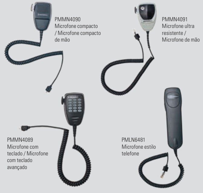
PMMN4090 Microfone compacto / Microfone compacto de mão