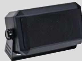
RSN4001 Alto-falante externo de 13W