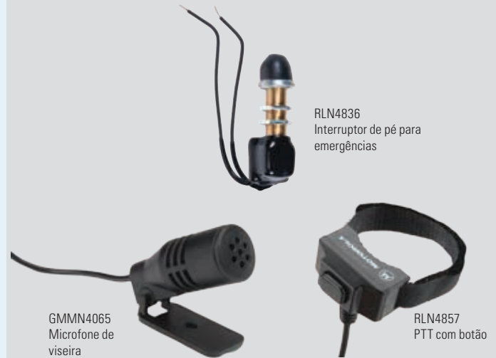
RLN4836 Interruptor de pé para emergências